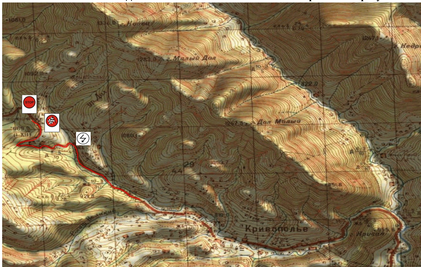
СХЕМА ТРАСИ 1-го ДНЯ ЗМАГАННЯ «ТРЕМБИТА-ГІРСЬКА» 14 травня 2016 року